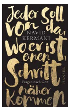
Navid Kermani: Jeder soll von da, wo er ist ..., Hanser 2022, 22 Euro.

3 Der Beitrag des Glaubens an einen Gott, der keinen Krieg will. Zusammenstehen, beten und nicht zuletzt das Schweigen vor Gott. Hilf! Erbarme dich.