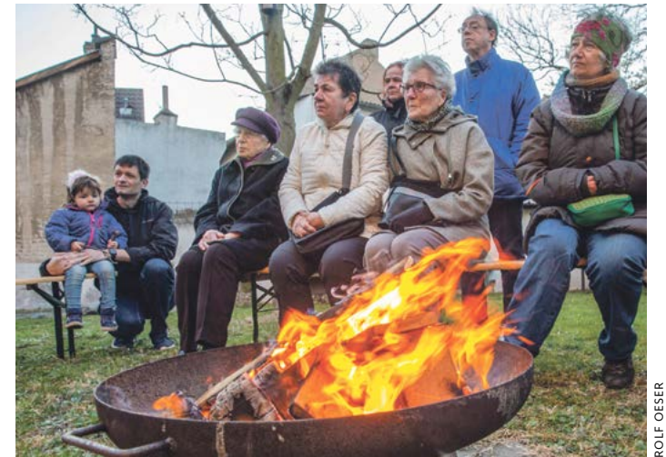
Beten für das Ende der Gewalt: Die Gemeinde Fechenheim entzündete ein Friedensfeuer für die Opfer des Kriegs.

Erneut: Was will Gott? Von uns? Hier in Deutschland. Wo wir keinen Krieg haben und ungestört unserem Alltag nachgehen können. Auf uns passt doch viel besser die Geschichte, die Jesus vom barmherzigen Samariter erzählt hat, der den Hilfsbedürf-